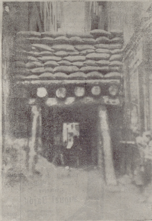
Bilbao: Una de las trincheras, utilizadas también como refugios, que los nacionalistas vascos construyeron en las calles de la ciudad.