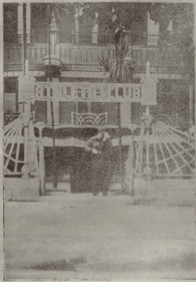
Bilbao: El local del Athletic Club.

El dinero de Euzkadi. - 4,80 un bote de pimientos. - El Athletic de Bilbao en Rusia. - El que no es agradecido no es bien nacido