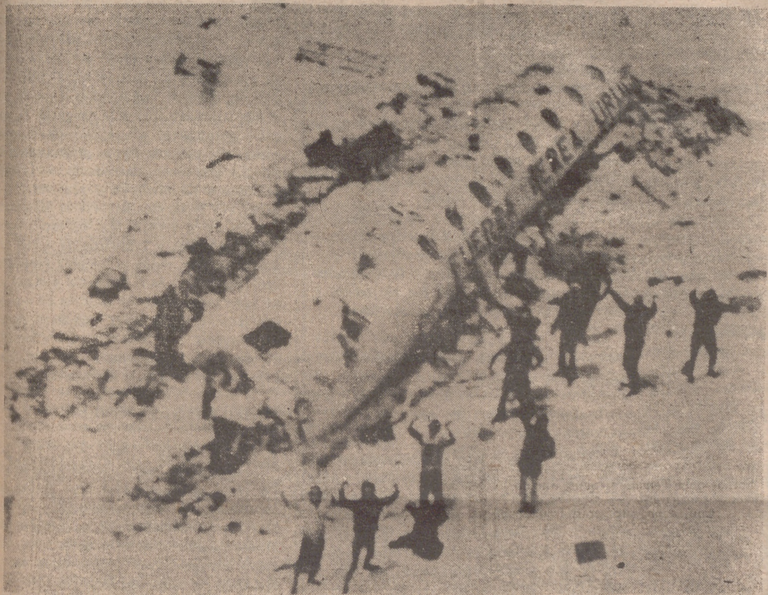
Este es el cuerpo del avión. Alrededor, los supervivientes. Por encima de ellos, el helicóptero de ayuda. Feliz Navidad.

● "PARIS MATH" OFRECE MEDIO MILLON DE DOLARES POR LAS FOTOGRAFIAS