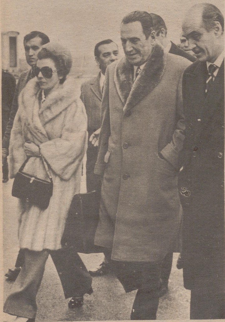
MADRID.— Después de su viaje a La Argentina ha regresado a Madrid el ex-presidente argentino General Perón, venía acompañado de su esposa Doña Isabel Martínez de Perón, y en la sala de prensa del aeropuerto de Barajas hizo unas declaraciones a la prensa.

Presencie gratis el ZARAGOZA-BARCELONA INVITADO POR