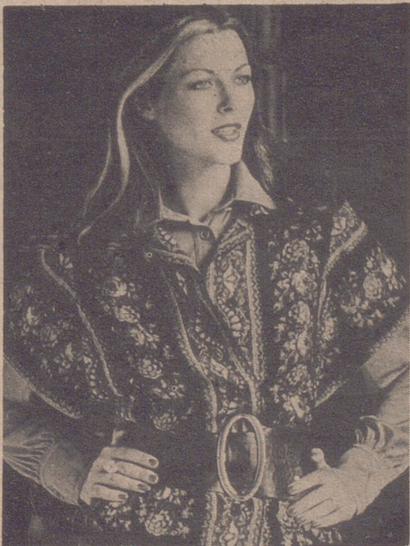
También para la mujer el cinturón, algo menos ancho que el del hombre, está realizado con frecuencia en dos materiales diferentes: cuero y tejido; piel de vaca y terciopelo, por ejemplo. Se observa un retroceso en las pieles caras tales como el cocodrilo y la serpiente.

También están los cinturones totalmente de metal, fabricados en piezas articuladas que les dan elasticidad y ajustan sin oprimir. Hay que destacar asimismo los cinturones con pequeños bolsillos aplicados, o con una sola carterita móvil.