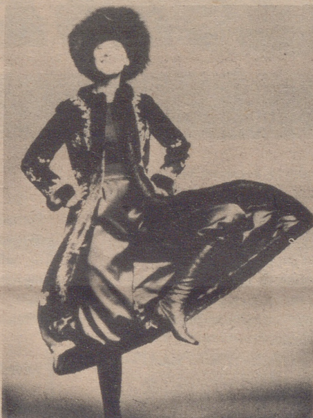
Pantalones para noche. En raso fucsia y botas del mismo tejido, como complemento de una casaca con ribetes de visón y gorro de la misma piel