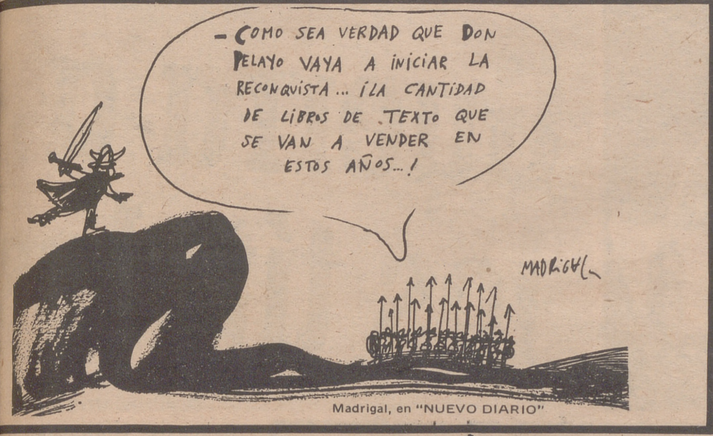
Madrigal, en "NUEVO DIARIO"