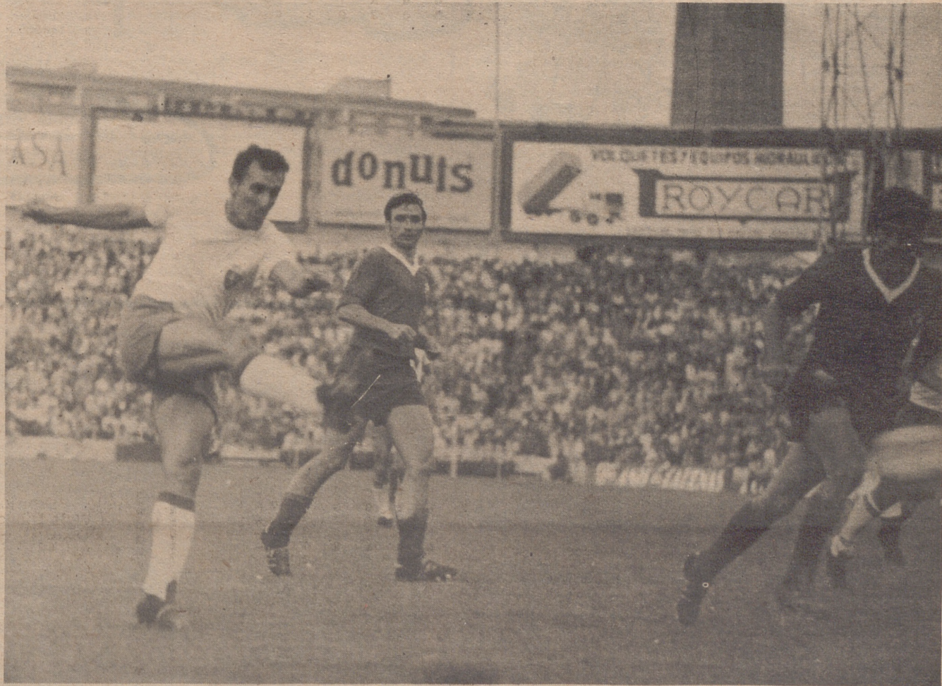
EL GOL DE LA CONFIANZA

EL GOL DE COSTA TRANQUILIZO A TODOS Y DIO LA JUSTA VICTORIA ZARAGOCISTA (2-0) SOBRE EL BURGOS