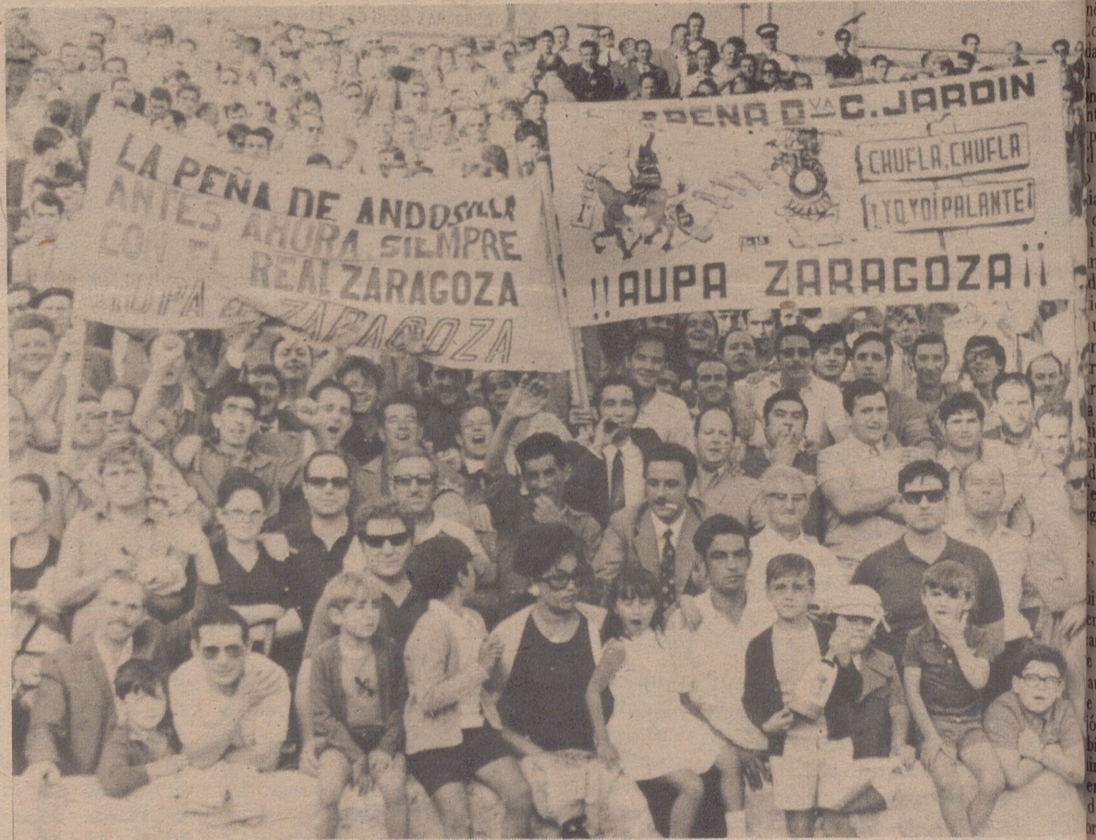
Bullicio, pancartas, caras sonrientes... o nerviosas... Es —¿hay quien lo dude?— la sal del fútbol

-¿Y el Burgos? -Difícil equipo. Lo será mucho más fuera de "El Plantío" que en su feudo. Saben defenderse. Y luchan, luchan. Vaya si luchan.