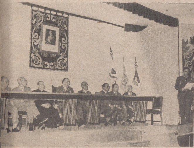
Las autoridades presidenciales en dicho acto

CLAUSURA DEL XVI CURSO PARA MANDO DE UNIDADES ESPECIALES