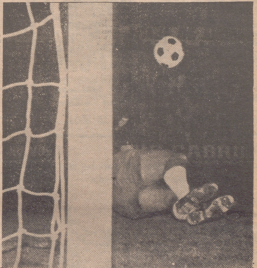
Este es el momento culminante del partido: el penalty. Villanova salvó airoosamente la encrucijada.

Luchó desde el principio tesoneramente por lograr la victoria. Pero querer no es poder y chutar a puerta seis veces escasas a lo largo de 90 minutos, es bagaje escasamente positivo para ganar. Incluyendo en esa media docena de intentos un penalty con el que fue castigado el Zaragoza por clara e inocente infracción de Royo dentro del área repeliendo un remate de Fontenla.