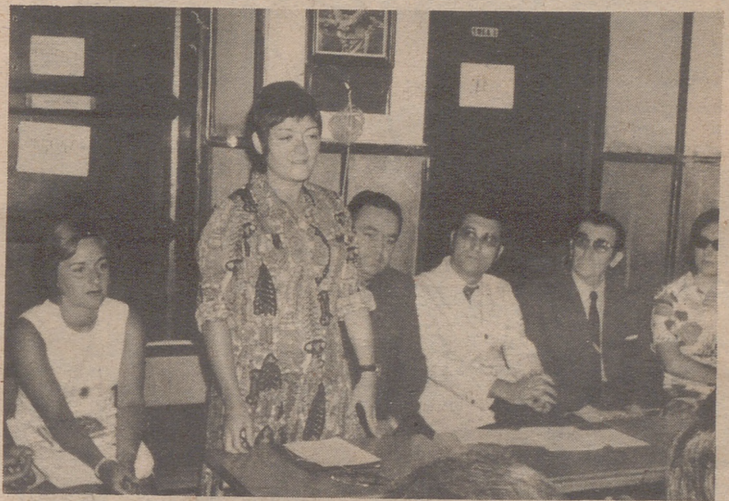
Formación humana, Hogar, Agricultura, trámites Administrativos y Actividades Culturales. Las explicaciones, claras, concretas, y concisas fueron asimiladas con gran aprovechamiento lográndose que más de 200 mujeres de la

Un profesorado competente estuvo al frente del Cursillo que comprendía numerosas materias: Religión, Aritmética, Decoración, Geografía, Historia,