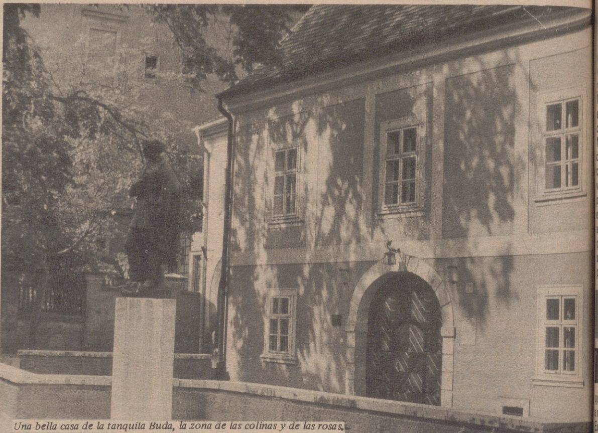
Una bella casa de la tranquila Buda, la zona de las colinas y de las rosas.