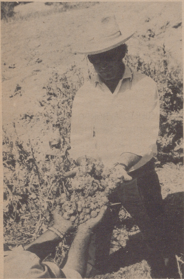
GRANADA.- Una fuerte tormenta de granizo arrasó dehesas enteras del pueblecito granadino de Guadix causando graves daños a la agricultura y ganadería. Véanse el tamaño de ciruelas de los granizos caídos sobre la comarca en poco menos de una hora. Párrales y olivares han quedado destrozado.