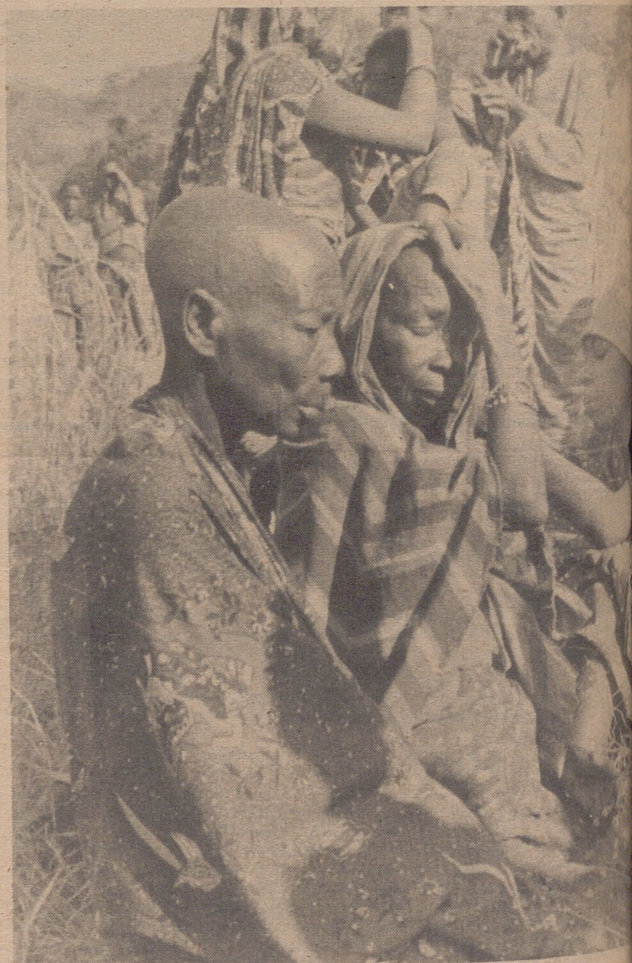
SWIMA, Zaire.— Algunos de los refugiados en el campo de Swima, provincia Kivo del Zaire, después de huir del estado de Burundi donde se perpetró una carnicería contra los miembros de la tribu Tutsi (número de 150,000) tras el del fracasado golpe de estado contra la minoría Tutsi en el poder.