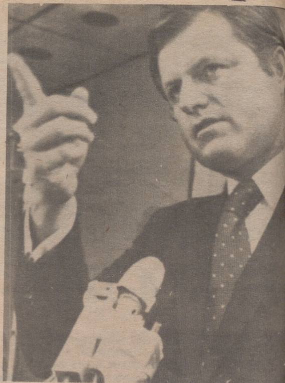
Kennedy rechaza la Vicepresidencia

"Los Estados Unidos no se retirarán del mundo y