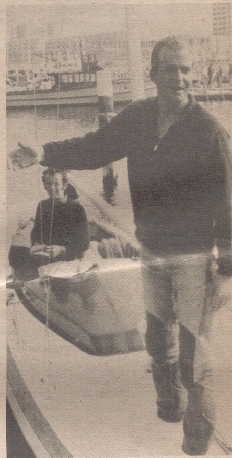
KIEL.— El príncipe don Juan Carlos en su yate olímpico, durante las pruebas náuticas de la semana preolímpica que vienen desarrollándose en Kiel y en las que está obteniendo una excelente clasificación.