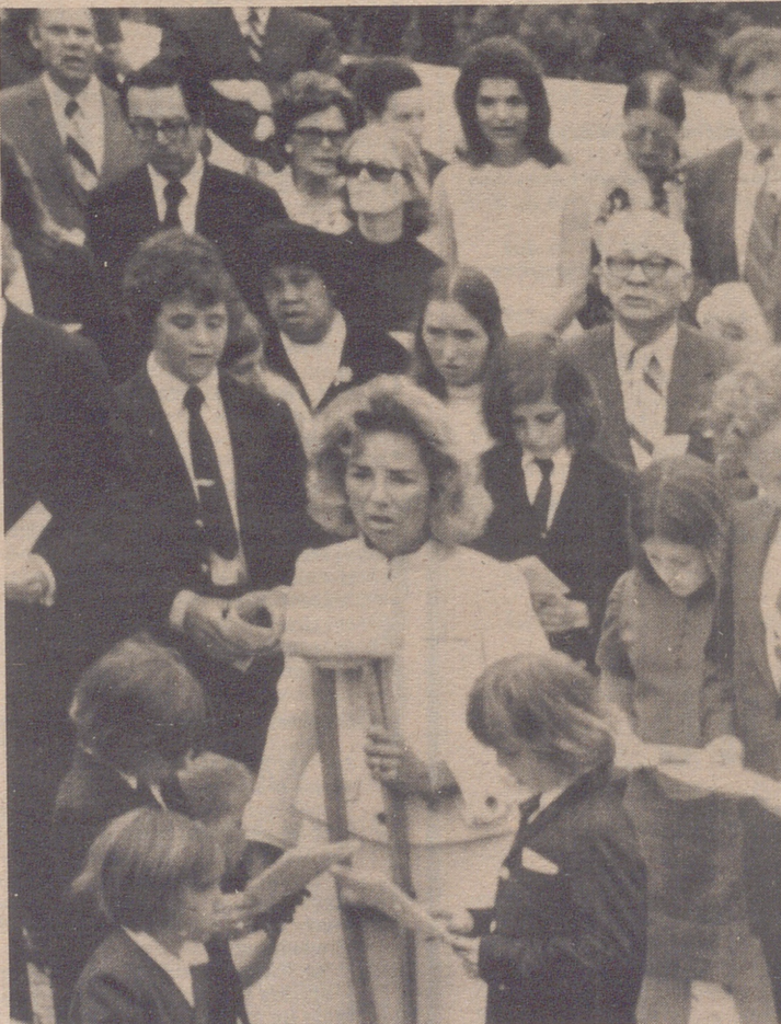
WASHINGTON. Ethel Kennedy, viuda del senador Robert Kennedy, con sus hijos en el acto celebrado ante la tumba de su esposo en el cuarto aniversario de su asesinato. En sus manos lleva las muletas que ha de utilizar debido a una reciente accidente esquiando. Al fondo Jacqueline Onassis.