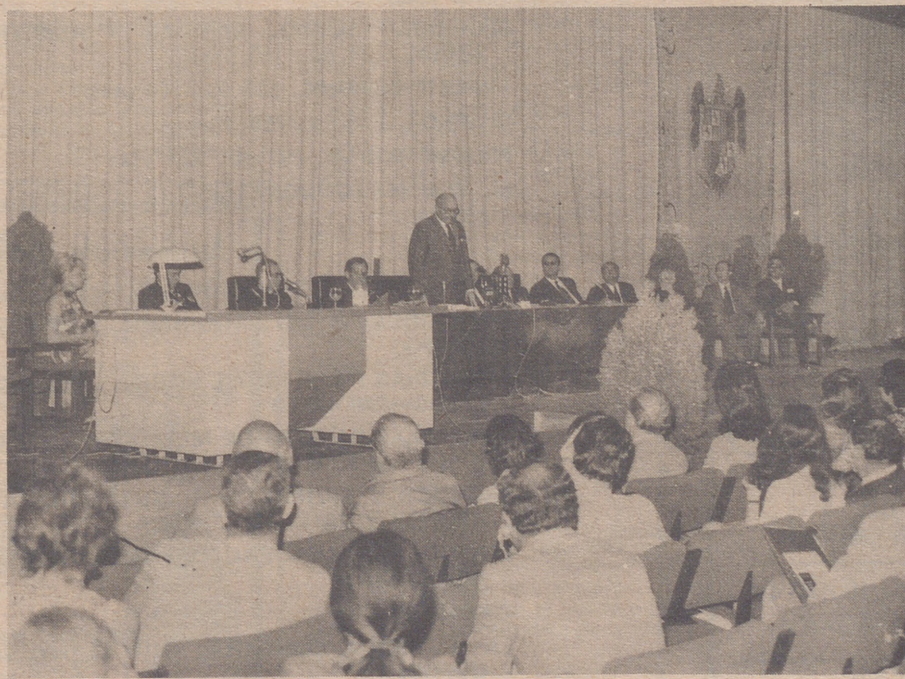
SEVILLA.— El Rector Magnífico de la Universidad de Sevilla durante la sesión de apertura en la Escuela Superior de Arquitectura de Sevilla del XVIII Congreso Internacional de Alcoholismo y Toxicomanía que se desarrollará en esta capital hasta el día 9 de este mes, en la que participarán el Dr. López Ibor y otros eminentes médicos e investigadores.