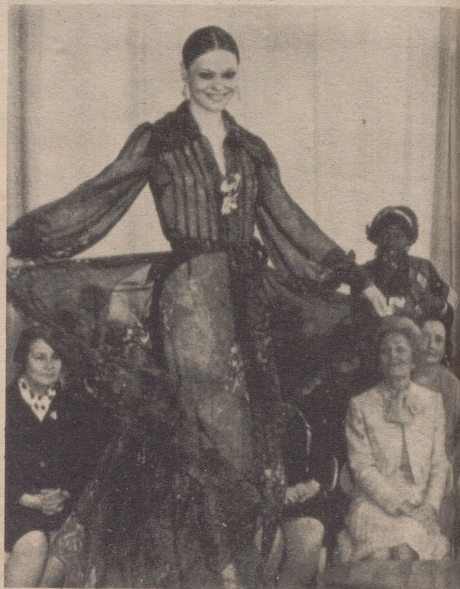
MOSCU.— Pat Nixon, esposa del presidente norteamericano, visitó hoy una casa de modas soviética donde contempló un desfile de modelos de un partido con las chicas que los exhibieron.

MOSCU, 26. (Efe).— El presidente Nixon y los dirigentes soviéticos continúan hoy sus consultas, aunque según indicios se evitan decisiones rápidas sobre los acuerdos que afectan la limitación de armas nucleares a la expansión del comercio y lazos económicos soviético-estadounidenses.