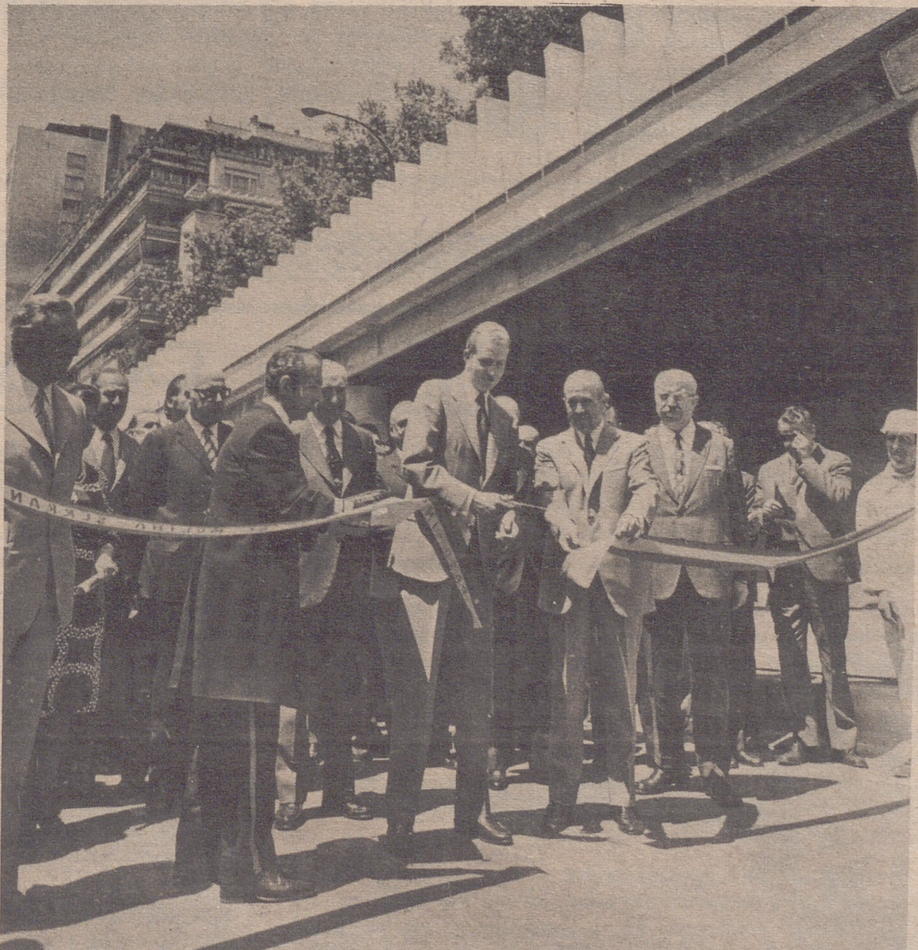
MADRID.— S. A. Real el príncipe de España don Juan Carlos acompañado por las primeras autoridades provinciales y el Ministro de la Gobernación, inauguró los pasos elevados de Bailén Ferraz, sobre la Plaza de España; y el de María Molina (subterráneo) sobre Serrano. En la foto un momento de dichas inauguraciones.