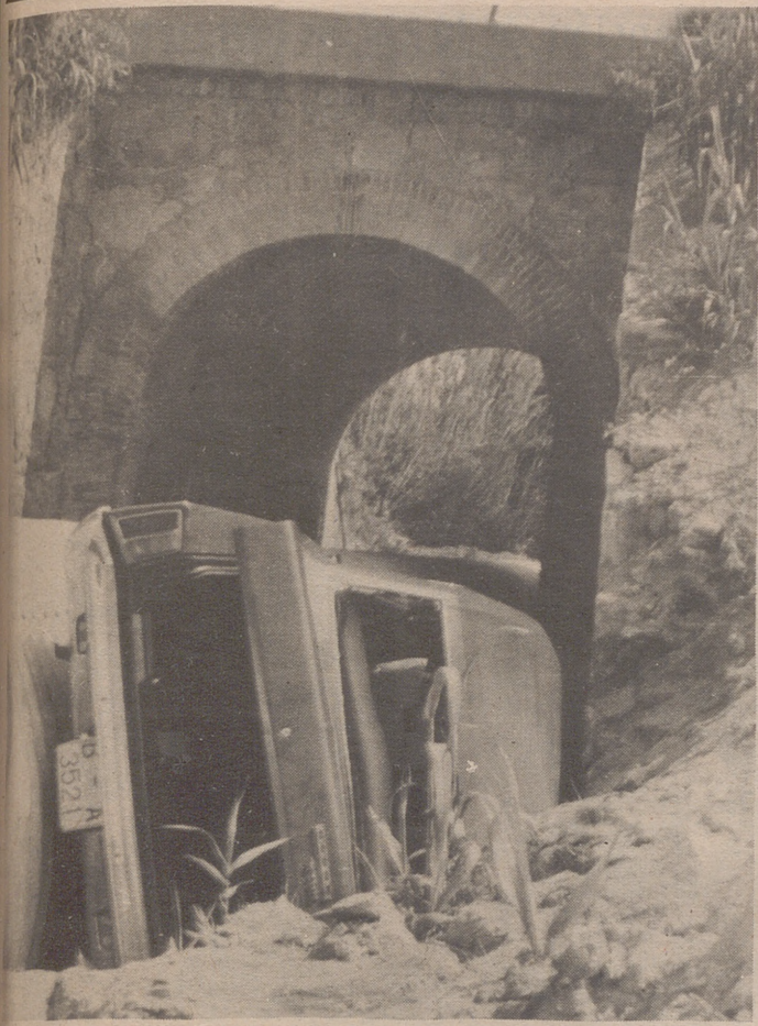
SAN CUGAT DEL VALLES (Barcelona).— En el kilómetro 16,15 de la carretera de Rubí a San Cugat, este vehículo derrapó a causa de la lluvia precipitándose por el puente. Los ocupantes, el conductor, esposa e hija resultaron con heridas graves.—(Foto Ap-Europa Press).