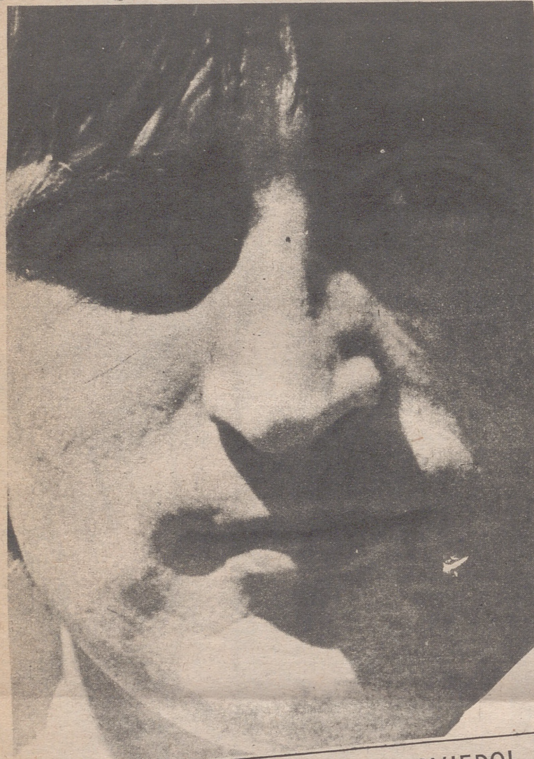
¡EL HOMBRE GOL DEL OVIEDO!