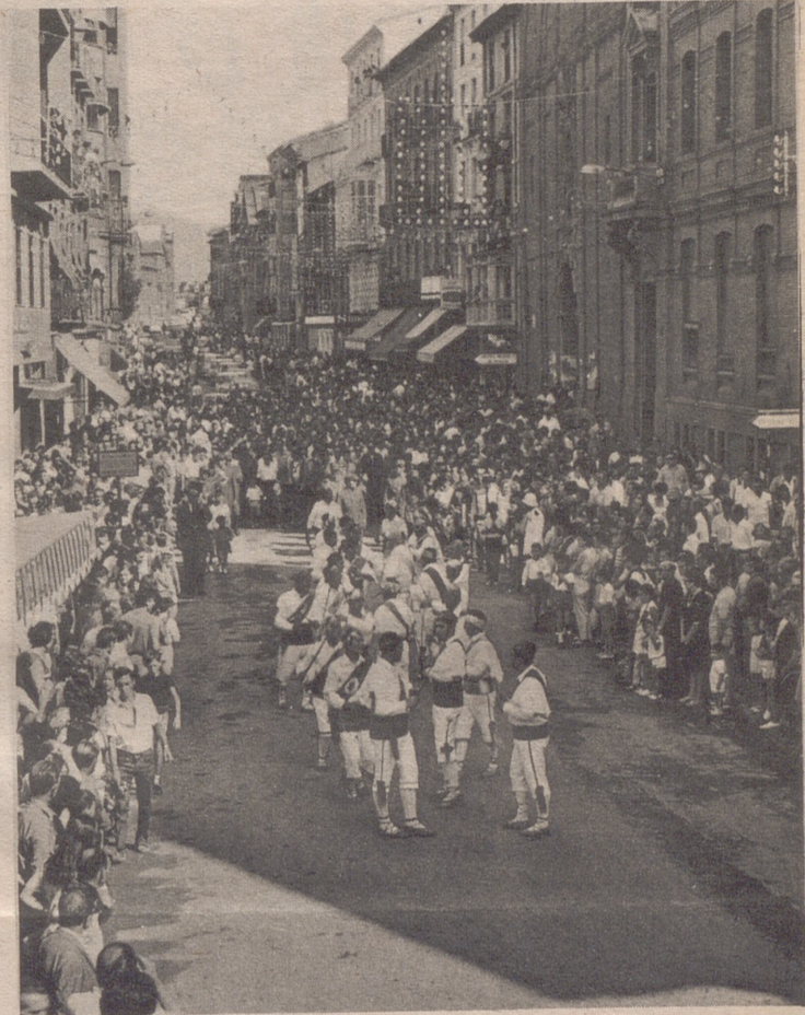
EL EJEMPLO DE LA ESCUELA DE JOTA

Por eso hay que intentar una operación de reactivación de esta faceta de nuestra cultura. No se nos diga que no hay afición. Para refutar esa tesis allí están esa cincuenta de niños, que día tras día, acuden sin fallar a la escuela de Jota, para aprender otra variación del caso: Los instrumentos de cuerda.