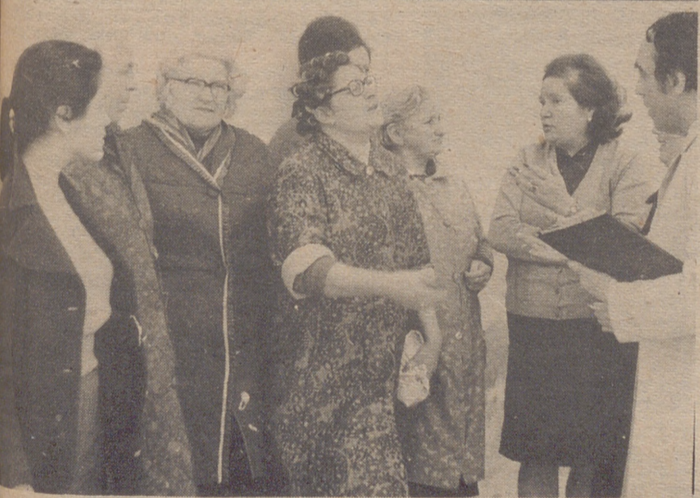
están las "Agustinas" como las llaman en el barrio, por su genio y por que ellas encienden... ¡Ah, si las mujeres mandasen!