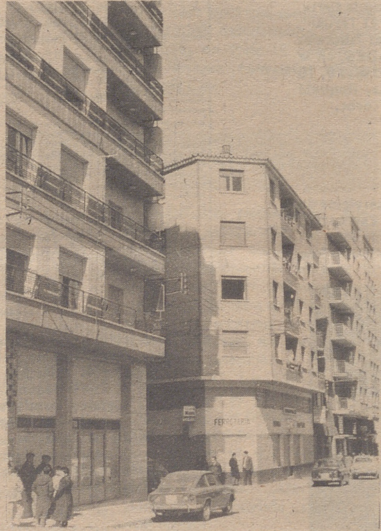
Menos de dos años de edad tienen estas casas de la calle de Purroy y algunos piensan que la piqueta ya está próxima. Ellas, sin embargo, allí están tan bonitas y tan felices. Ellas no son personas. Ellas no se asustan. Con ellas, el pánico no va.

C UNDIO la alarma en Torrero. Esto pudimos comprobarlo cumplidamente ayer. Es un miedo, a nuestro entender, provocado por una deficiente información. Todos dicen que si el Ayuntamiento dice tal cosa, que si va a hacer y deshacer, pero de lo dicho a este respecto por el Ayuntamiento, se sabe tan poco que no se sabe casi nada. Todo es en el barrio de Torrero confusión y alarma. Pero es el caso que allí la alarma ha cundido con tal fuerza que muchos creen estar con la soga al cuello o con el agua hasta el pescuezo, como si ya sintiera en su propia carne el temblor de las piquetas derribando las paredes de su vivienda.