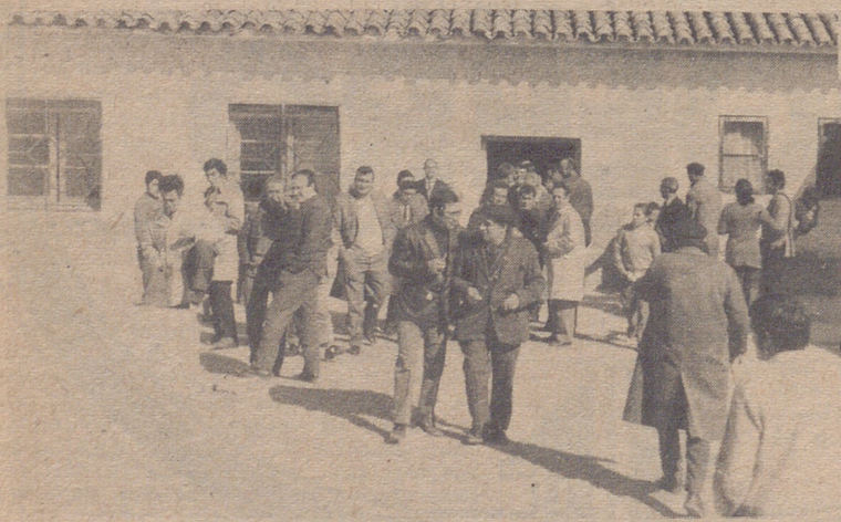
Son las Escuelas del Barrio de la Paz convertidas en oficinas para recoger los escritos de protesta. Así estuvieron de animadas toda la mañana de ayer.