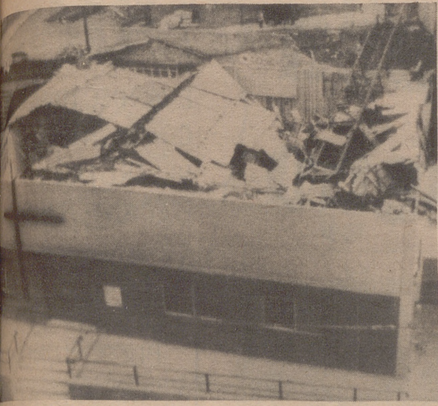
BILBAO.— A consecuencia del fuerte vendaval en Portugalete ha caído gran parte sobre la Parroquia María Madre de la Iglesia, que destruyó todo edificio de moderna construcción, como bien puede apreciarse en la.

Trágico accidente en la calle de San Jorge, esta madrugada