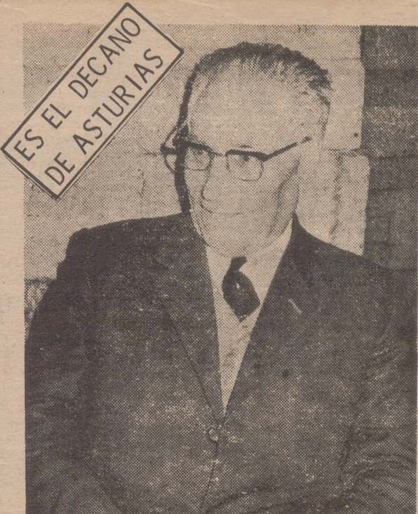
ES EL DECAÑO DE ASTURIAS

Entre otras, son atribuciones de la permanente: hacer declaraciones sobre temas de urgencia, sobre las cuales informará previamente a la Santa Sede, estudiar el presupuesto económico de la Conferencia, preparar y convocar la Asamblea, aprobar los reglamentos internos de la propia conferencia y nombrar los consiliarios y altos cargos nacionales de los movimientos apostólicos a propuesta de los prelatos u organismos encargados de su dirección y los asesores o representantes de la jerarquía en otros organismos de la Iglesia de carácter nacional.