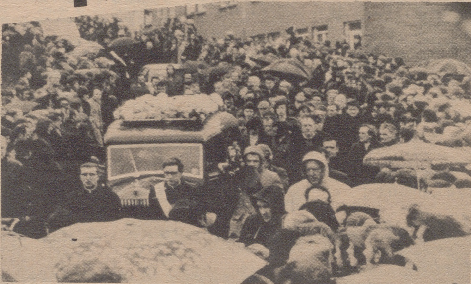
LONDONDERRY.— Impresionante manifestación de duelo de las víctimas del domingo sangriento en Londonderry donde 13 personas perdieron la vida a consecuencia de los disparos de los soldados británicos.