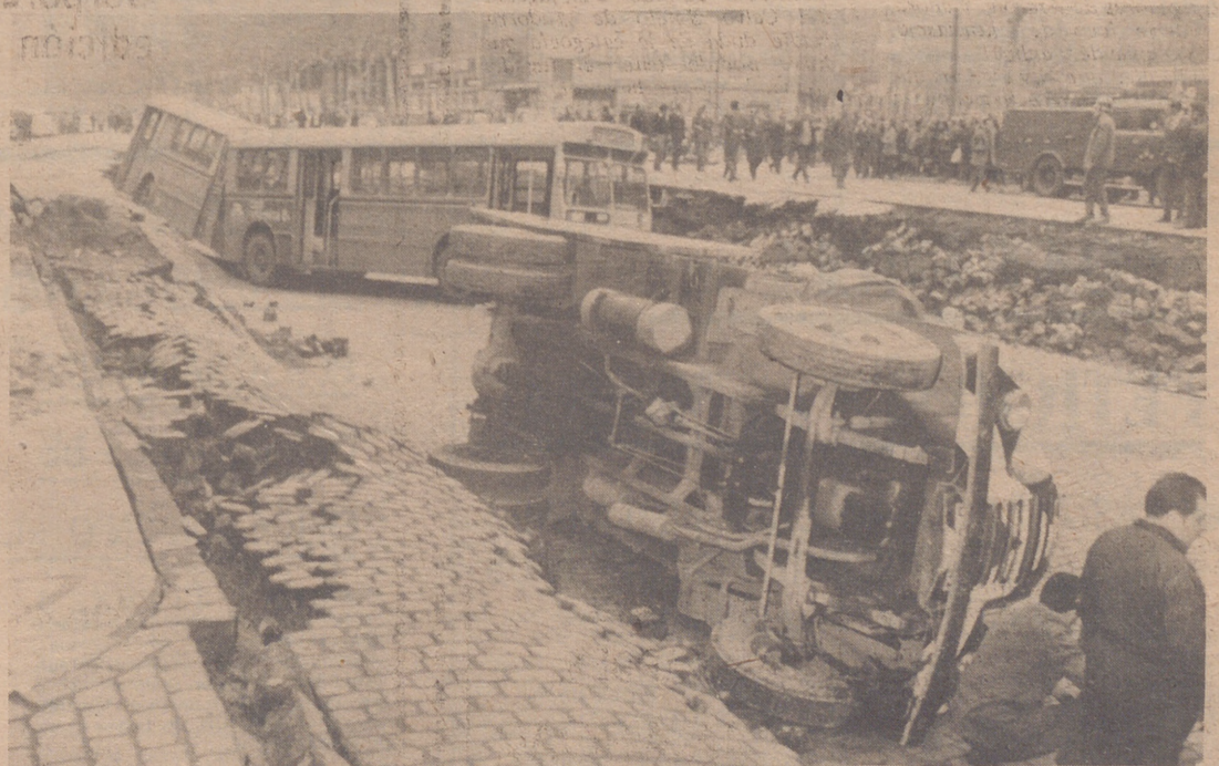
BARCELONA.— Esta tarde se hundió el suelo en la calle Marqués del Duero tragándose un autobús, un camión, una furgoneta y varios coches más. En la foto vemos parcialmente el lugar siniestrado.