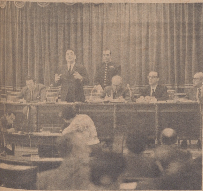
MADRID.— Don Gonzalo Fernández de la Mora, ministro de Obras Públicas, durante su información a Las Cortes, de la realización y proyectos de su Departamento. Es la cuarta vez que el Ministro de Obras Públicas informa a la Cámara.