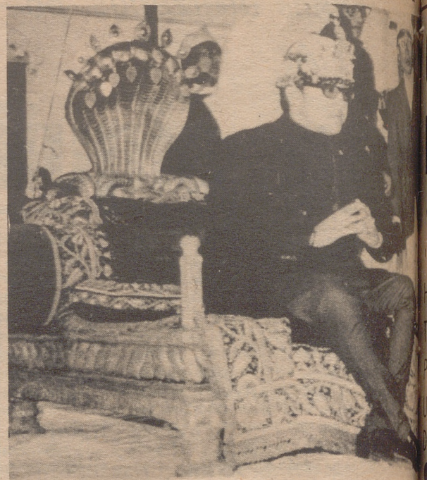
KATMANDU.— El Rey Birenda de Nepal después de su coronación, muere de su padre que sufrió un ataque al corazón. El rey fue recibido por las calles de Katmandu por la multitud.