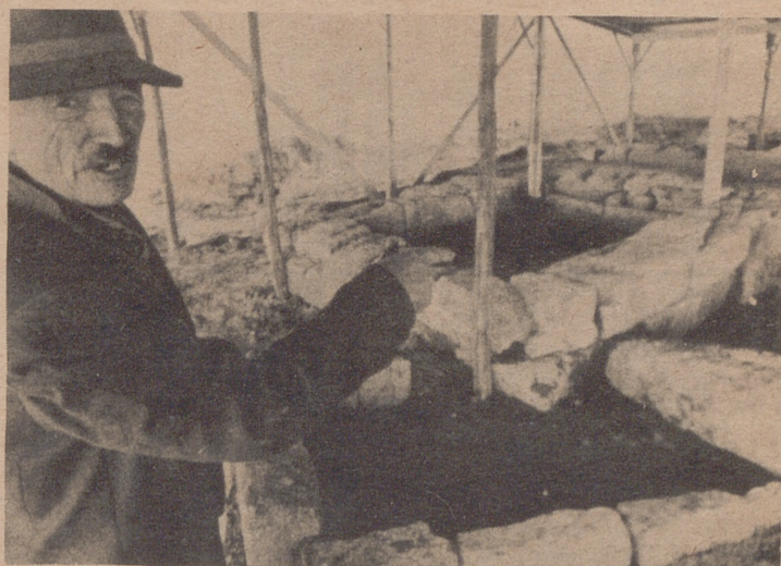
ROMA.— Un campesino señala las ruinas de un templo preromano cerca de Patrica di Mare, que data aproximadamente de hace 26 siglos. Se cree está construido en el lugar donde el Legendario Eneas, heroe Troyano fundó Roma y es el lugar donde está enterrado.