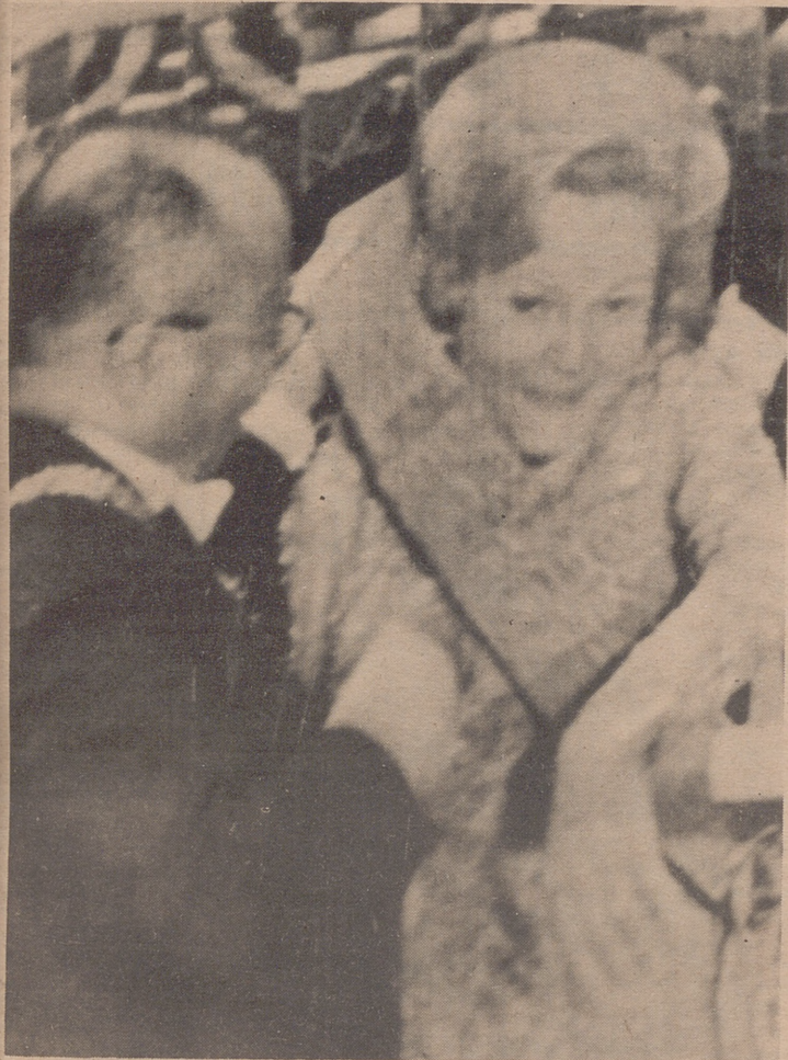
MONROVIA.-La esposa del presidente Nixon recibe de manos del presidente de Liberia William Tolbert la más alta condecoración de este país. La más Venerable Orden de Pioneros.

● EL PRIMER MINISTRO NIPON, EN SAN CLEMENTE