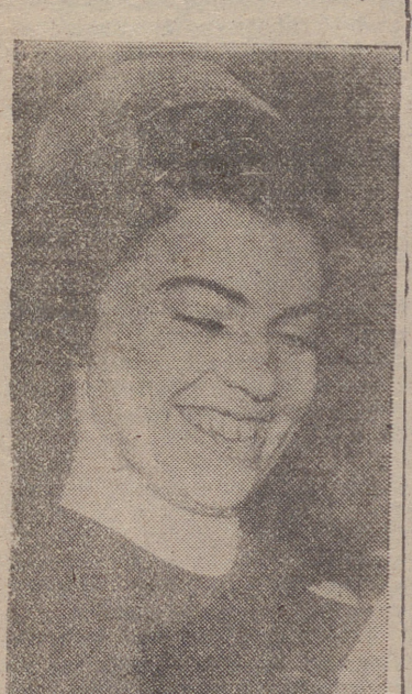
Una reciente foto de la princesa Margaretha de Suecia.

Y, sin embargo, a la vista está cuánto hieren a la imaginación po-