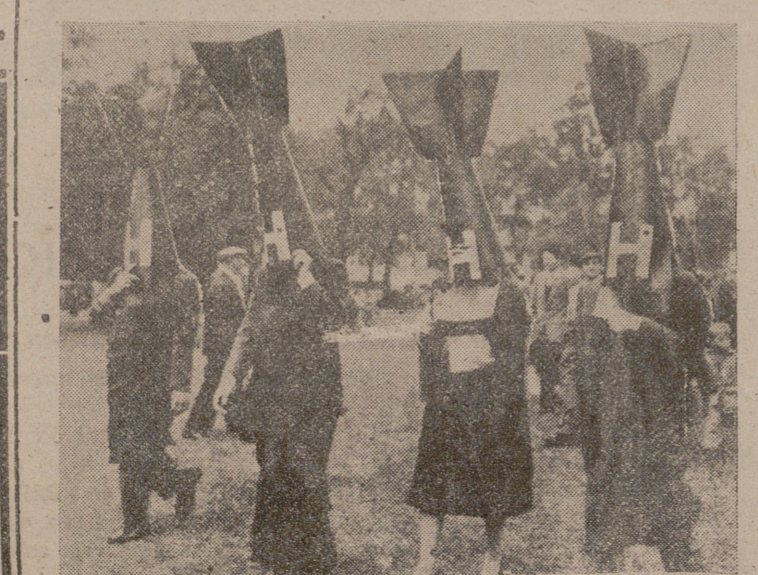
LONDRES. — Estas cuatro personas, cubriendo sus cabezas con capirotes en forma de bomba, marchan a través de Hyde Park durante una reunión política y como protesta contra el empleo de las bombas de hidrógeno.