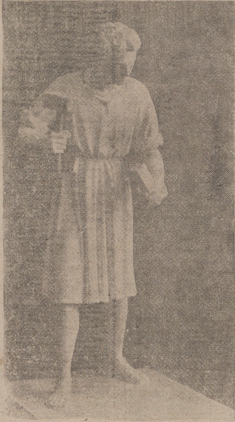
En Cristo está la más alta dignificación del trabajo y del trabajador. Por eso queremos que presida nuestro número en este día de la festividad obrera del primero de mayo la imagen del Divino Redentor en esta expresiva escultura de Víctor de los Ríos que evoca las escenas artísticas del glorioso taller de Nazaret.