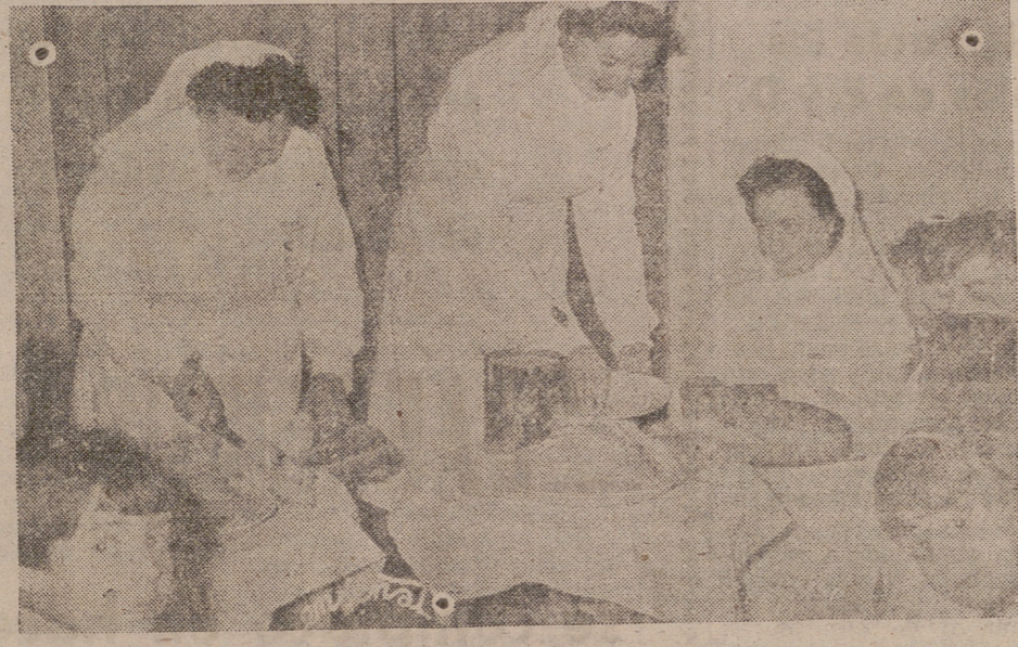
Distribución de la merienda a los niños de la escuela de Párvulos