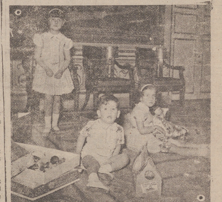
EL PARDO.— Los nietos de S. E. el Jefe del Estado, sorprendidos por el fotógrafo mientras se dedicaban a sus juegos con algunos de los juguetes recibidos de los Reyes Magos.