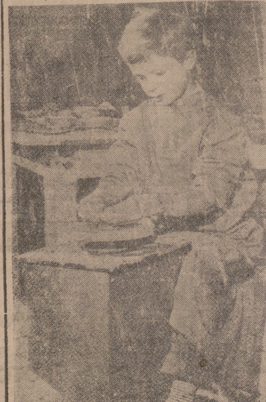
Carlos Gustavo de Suecia, alfarero En la foto, el príncipe Carlos Gustavo de Suecia, de 9 años, gran entusiasta del arte de alfarería, prepara personalmente varios motivos navideños en su propio taller, instalado en el Palacio Real de Estocolmo.

El mensaje de S. S. el Papa, en 28 idiomas CIUDAD DEL VATICANO, 22.—La radio vaticana transmitirá el mensaje navideño de Su Santidad, Pío XII, en 28 idiomas, entre el 24 y el 28 del actual.—(Efe).