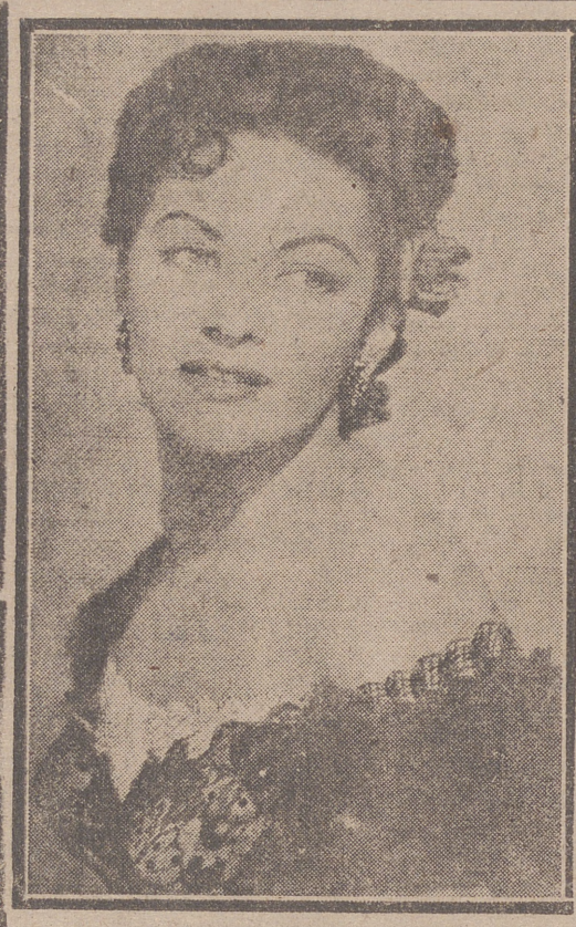
IVONNE DE CARLO