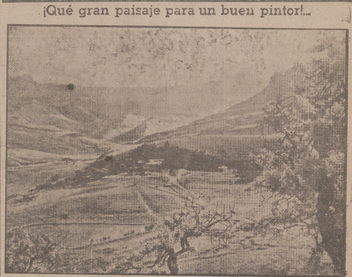
El "Anfiteatro" del Parque Nacional de Natal, en las Montañas de los Dragones, paisaje de poesía y ensueño y una de las muchas atracciones turísticas de la Unión de Africa del Sur.

«El canciller Adenauer dijo al final de su discurso que cuando las tropas soviéticas cruzaron la frontera alemana y continuaron su avance, también cometieron atrocidades. Lo niego en forma categórica. Las tropas soviéticas estaban cumpliendo un sagrado deber hacia el pueblo soviético y por eso continuaron las hostilidades. Si las tropas hubieran atacado a Alemania y Alemania se hubiera defendido (podría llamarse a esto atrocidades?)»