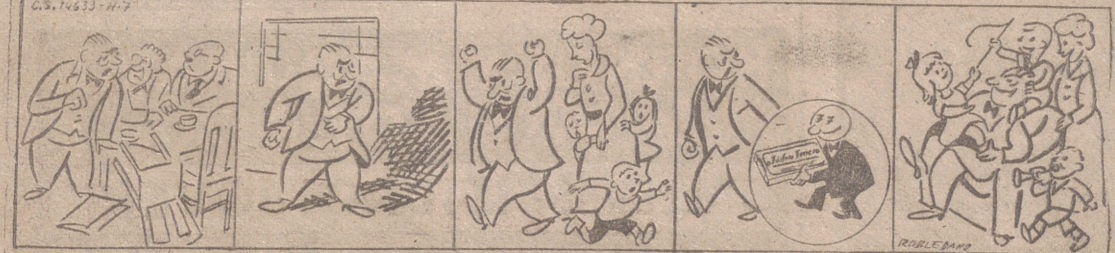
Era él, tirado insoportable con un grano insoportable. De lo amargado que estaba con su sombra se pegaba. A su mujer y a sus hijos asustados con sus gritos. Esto ni debes tomar y te has de modificar. Tomó el Fosforo Ferrero y se hizo fuerte con un verdadero