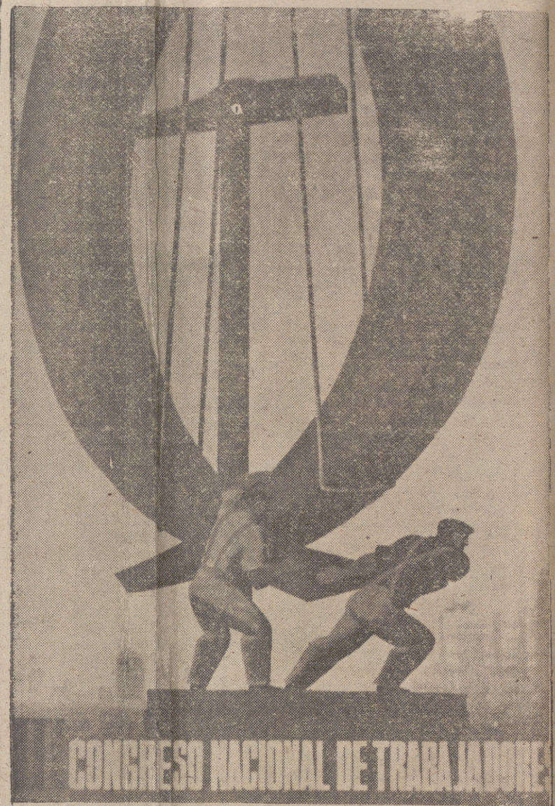
CONGRESO NACIONAL DE TRABAJADORES

El día 12 del próximo mes de julio dará comienzo en Madrid el III Congreso Nacional de Trabajadores, en el cual serán discutidos todos los problemas que los mismos tienen planteados con la participación de sus genuinos representantes. Las conclusiones que en este Congreso han de adoptarse tendrán la mayor trascendencia, puesto que permitirán a los Poderes públicos conocer el pensamiento y la inquietud de los trabajadores de la industria y de la agricultura en forma auténtica. Por otra parte, los estudios llevados a cabo en los diversos Congresos Regionales celebrados con carácter preparatorio permitirán mantener las discusiones en un necesario nivel de madurez y ponderación.