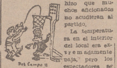
Del Campo II

una vigorosa reacción, pero no encontró el suficiente apoyo en sus compañeros para evitar los rápidos avances de los españoles, y se llegó al descanso con la notable ventaja para España de 44-16. En la segunda parte, España realizó otra exhibición de su potencia. Jorge Parra anegó, con facilidad, en seis ocasiones, y Garrido consiguió otras tres canastas, al mismo tiempo que cedió magníficos balones para que sus compañeros marcaran. Los pases de Garrido fueron perfectos y su manejo individual de la pelota desconcertó por completo a la defensa holandesa. A los diez minutos de este tiempo, España llevaba una ventaja de sesenta y cinco treinta y tres. El dominio de España fue absoluto en todo momento, y tres minutos antes