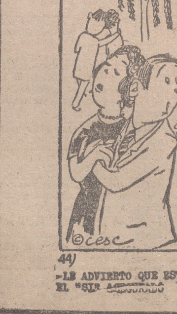
LE ADVIERTO QUE ESTAS MARGARITAS TIENEN EL SÍR...