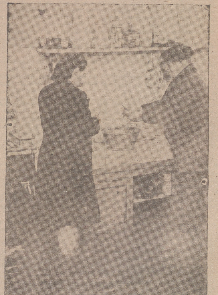
PARIS.—El Ródano, como otros ríos de Francia, ha desbordado a causa de las últimas lluvias. Los habitantes de Givors resisten las inundaciones. Este matrimonio, por ejemplo, que no ha abandonado su hogar, da muestras de su serenidad y preparan la comida con el agua casi hasta las rodillas.