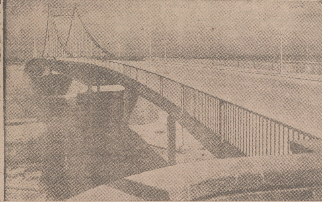
Hoy como ayer, la ingeniería alemana sigue bien afirmada en su alto prestigio mundial. Y cada día ofrece nuevos motivos para ello. Véase este magnífico puente construido sobre el Rhin en Krefeld del que el grabado muestra una bella perspectiva.

La «Royal Society», de Londres, acaba de anunciar que se va a emprender un estudio de los fenómenos meteorológicos, entre otras muchas investigaciones, sobre las fuerzas naturales de la tierra, por medio de una encuesta científica mundial, que se celebrará desde el mes de julio de 1957 al de diciembre de 1958. Se espera contar con la participación de 36 naciones, aproximadamente la mitad de las existentes en todo el Globo. La cantidad de dinero