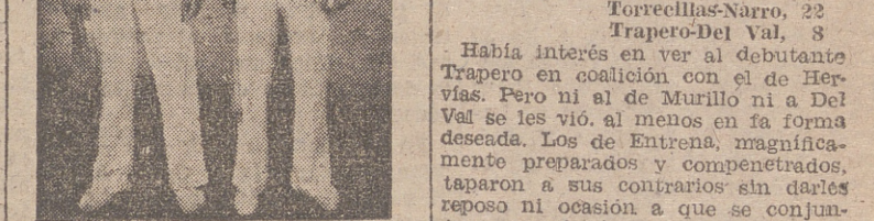
Los palacotistas Palacios y Díaz de Greñu, que este año volverán a representar a la Rioja en el torneo GRAVN