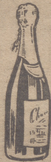
UNA BOTELLA DE CHAMPAN