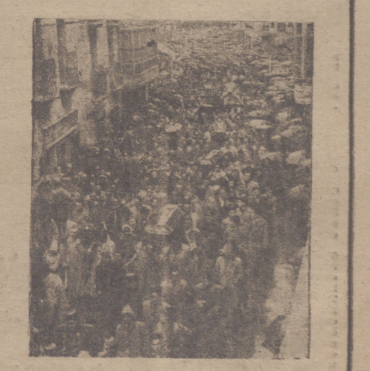
El domingo se produjo en Miranda de Ebro un dramático suceso. Un tropel de criaturas cayó por una escalera de la cripta de la Parroquia de San Nicolás de aquella ciudad y diez niñas resultaron muertas por asfixia. Ayer, lunes, tuvo lugar el sepelio de las víctimas, produciéndose la imponente manifestación de duelo del pueblo mirandés que recoge el grabado.

(MAS INFORMACIÓN DEL TRÁGICO ACCIDENTE EN LA TERCERA PAGINA).