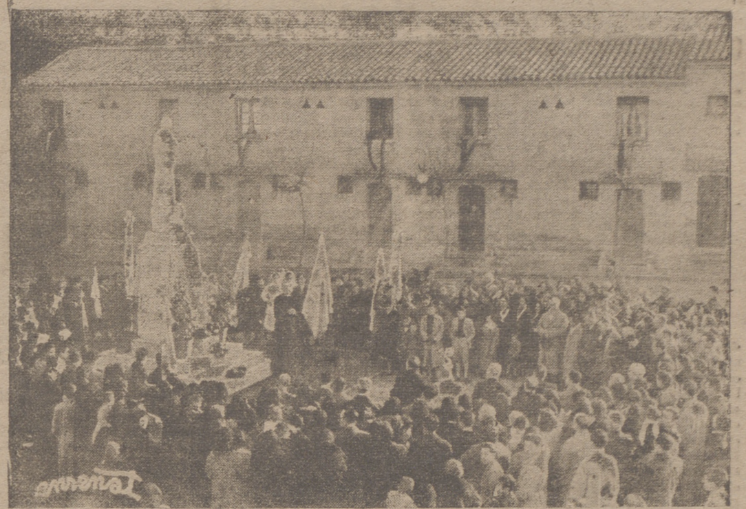
Un aspecto de la plaza de la barriada obrera logroñesa de «Martín Ballester» durante el solemne acto de inauguración del monumento a la Inmaculada que ha sido erigido en la misma por la Congregación Mariana de Hijas de María y que se celebró el domingo. — (Información en la página octava).