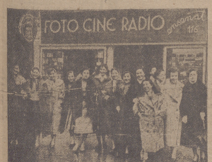
Ayer, lunes, festividad de Santa Cecilia, el gremio de la Confección del «Modesto Textil» honró a su Patrona en toda España con diversos actos. En Logroño, los celebrados se desarrollaron con gran brillantez y especialmente las modistillas, con su alegría y su belleza, como este grupo de guapísimas muchachas que fotografió Eusebio, pusieron una nota de simpática animación en nuestras calles.