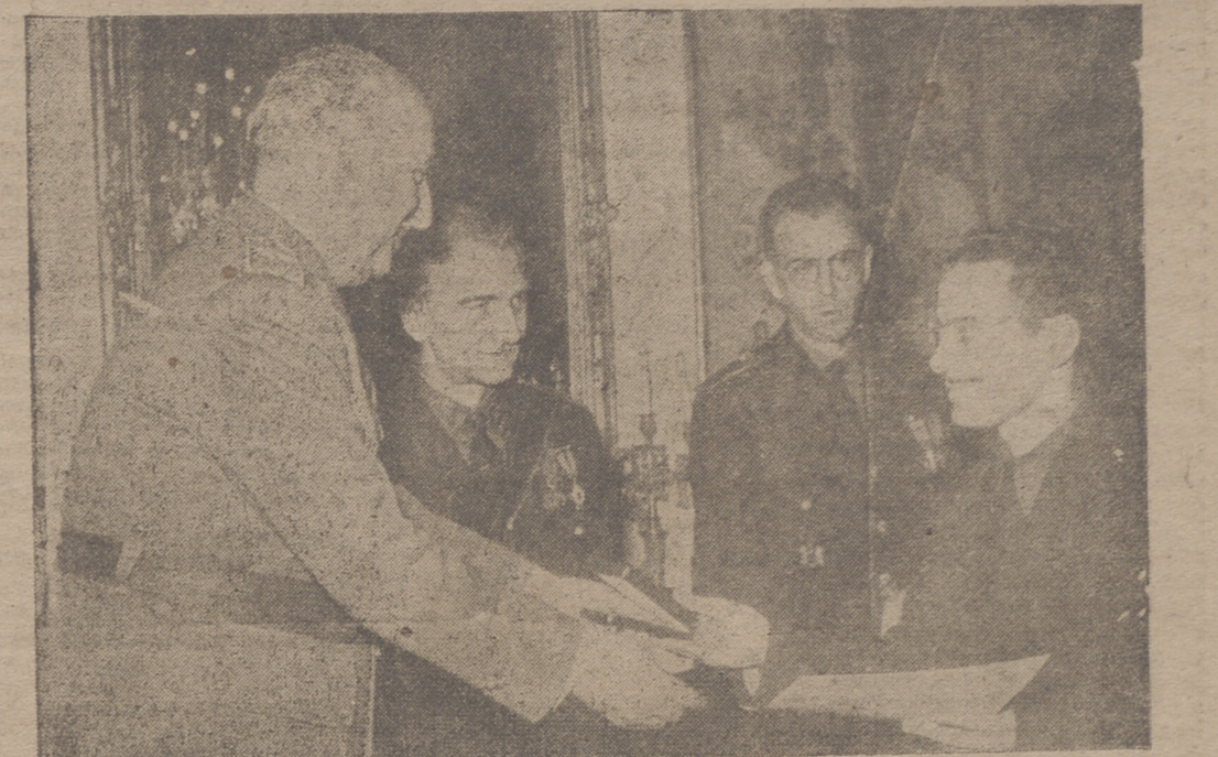
EL CAUDILLO. — Su Excelencia el jefe del Estado haciendo entrega de los premios fin de carrera y de formación obrera a los jóvenes que han merecido este honor.