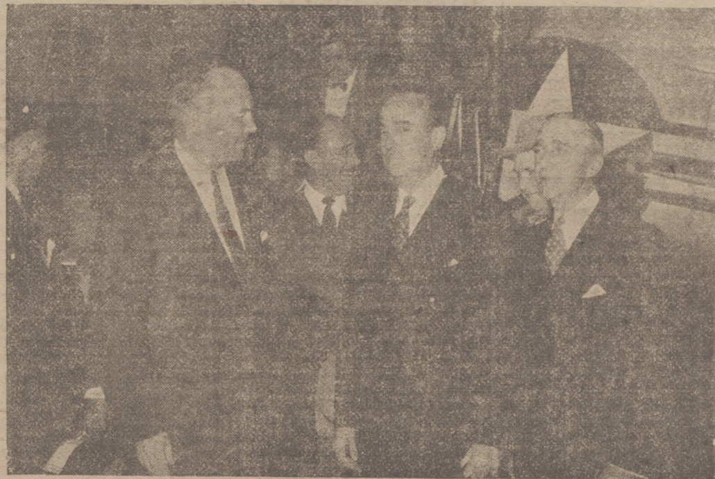
MADRID. — Un momento de la llegada a la capital de España por el aeropuerto de Barajas del director de la F. O. A., Mr. Stassen, que fue recibido por el ministro de Comercio, embajador de los Estados Unidos y otras personalidades. — (Otra).