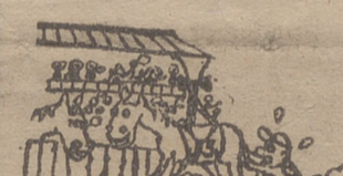
Del Concurso de Harrisburgo.