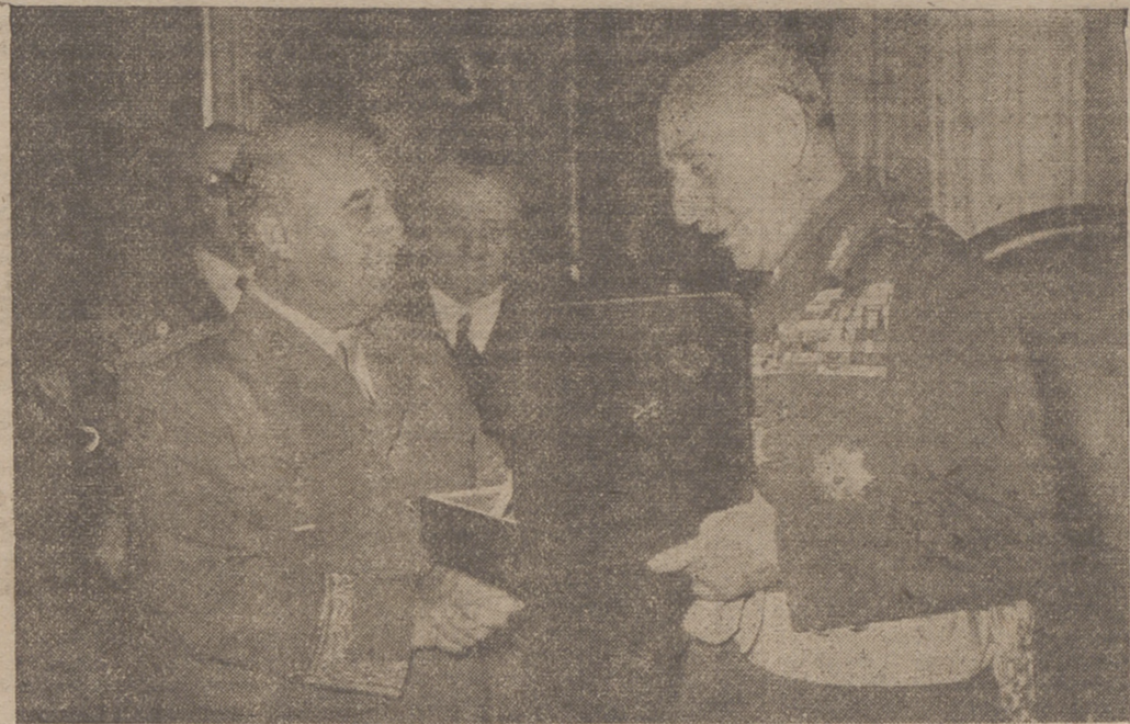
MADRID. — Un momento de la audiencia especial concedida por S. E. el Jefe del Estado al jefe del Gobierno griego, mariscal Papagos, durante la cual éste hizo entrega al Caudillo de las insignias de la Gran Cruz de la Orden del Salvador, y, a su vez, el mariscal Papagos recibió la Gran Cruz de Carlos III (Otra)