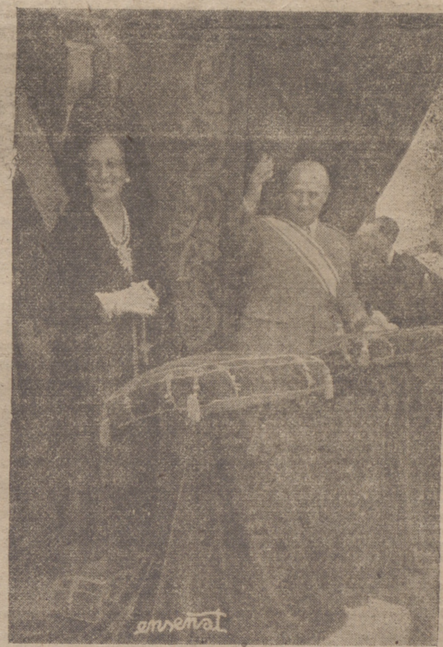
El Jefe del Estado y su esposa corresponden afectuosamente a las apoteósicas aclamaciones con que el pueblo riojano acogió su presencia en el acto de coronación de su excelsa Patrona.