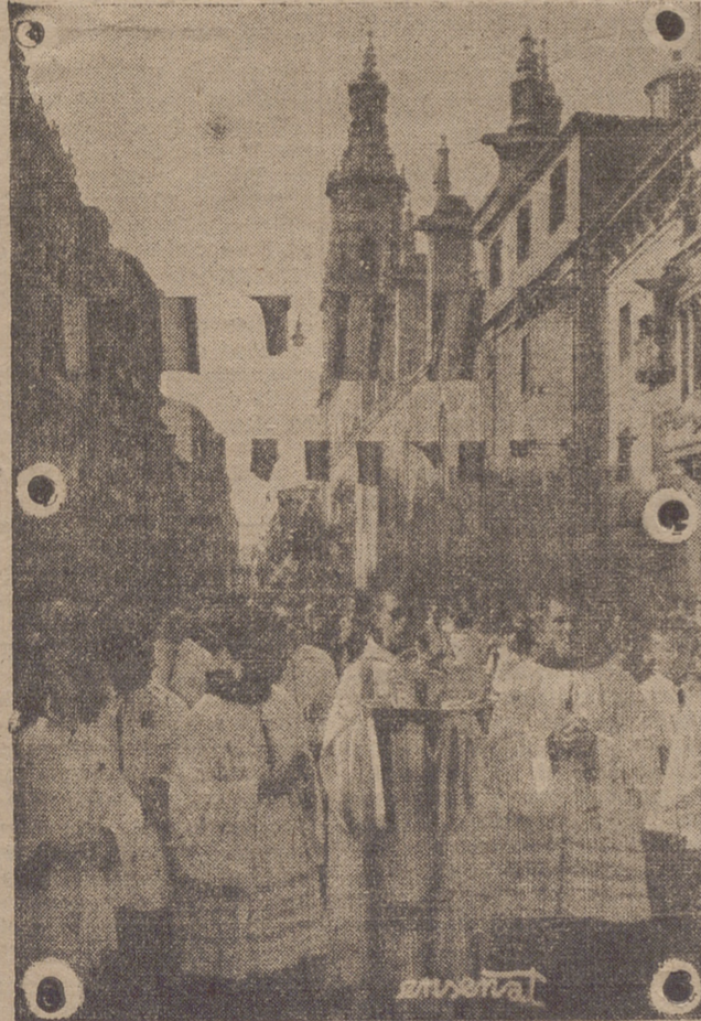
Después de su coronación, la imagen de Nuestra Señora de Valvanera es trasladada procesionalmente a la Colegiata.

La imagen partirá a las ocho menos cuarto en punto de la Iglesia de la Redonda y se despedirá de Logroño en la Plaza del Quiés de Murrieta.