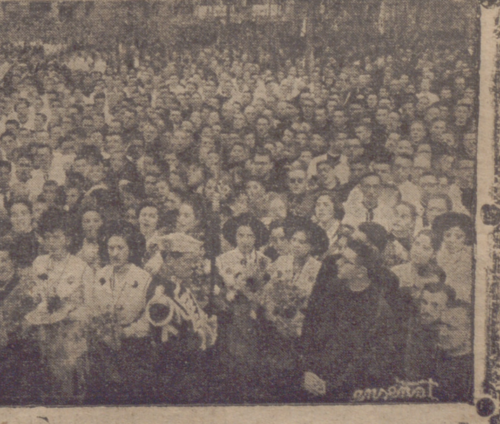
NOTAS GRAFICAS DE LA CORONACION DE LA VIRGEN DE VALVANERA. --- Los grabados muestran, de izquierda a derecha: El Capítulo de Caballeros de la Orden de Nuestra Señora de Valvanera, que formó en el traslado procesional de la imagen. --- El altar donde tuvo lugar la ceremonia. --- Una vista parcial de la muchedumbre que asistió al solemnisimo acto.