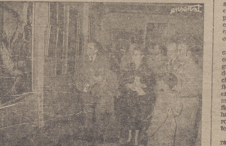
Un momento del acto inaugural de la exposición de reproducciones de pintura española que, enviada por la Delegación Nacional de Educación y patrocinada por la Excmo. Diputación y el Excmo. Ayuntamiento de Logroño, quedó antesayer abierta al público en el Salón de Exposiciones de la Obra Sindical «Educación y Descanso» y que está siendo visitadísima.