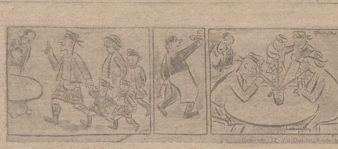
Humor sin palabras. Copyright, 27. Van Dijk Int. Amsterdam