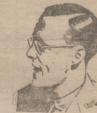
PRINCIPE BERNARDO DE HOLANDA

DOVER (Inglaterra), 21.—La reina Juliana de Holanda y el príncipe Bernardo han llegado a Dover, a bordo del crucero holandés «Jacob Van Keamskerck», efectuando una visita oficial a Inglaterra.—(Efe).