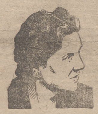
REINA JULIANA DE HOLANDA

Es acompañada por su esposo, el príncipe Bernardo, y ambos aclamados por el pueblo londinense a su paso en compañía de los reyes de Inglaterra