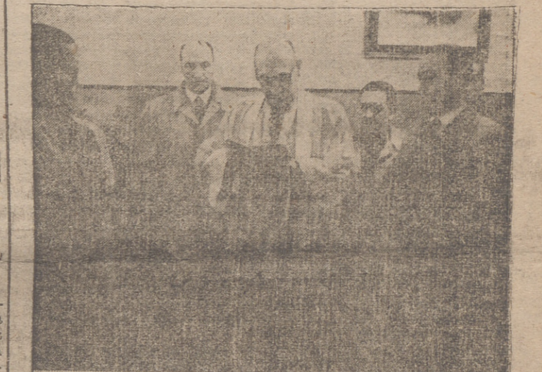
Momento de la bendición de los Ambulatorios de la Obra Sindical «18 de Julio». — El delegado nacional de Sindicatos preside el Cabildo de la Cámara Sindical Agraria.

El canciller, señor Díaz Ordóñez, agradeció, en términos muy efusivos, la distinción de que era objeto por el Gobierno español que aceptaba, dijo, como un homenaje que España rendía al presidente Trujillo.—(Efe.)