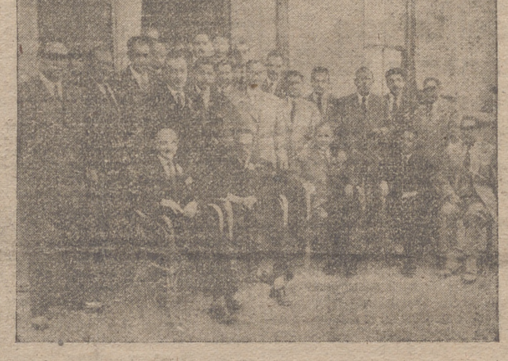
Actuación religiosa en la iglesia de Santa María de Palacio, donde se celebró la fiesta de San Mateo.

que se celebraba había sido dicho ya, el Ilmo. señor delegado de Hacienda. Se lamentó, conforme al sentir de todos, que estuviera ausente de estos actos que se celebraban, el Ilmo. Sr. director general del Tesoro, tan querido en Logroño. Terminar, sin embargo, dijo, con una consigna para todos cuantos intervinieren en el complejo recaudatorio: La mayor consideración para el elemento rural, los campesinos, como seres dignos de las más grandes y delicadas atenciones especiales, y los más dignos de consideración.