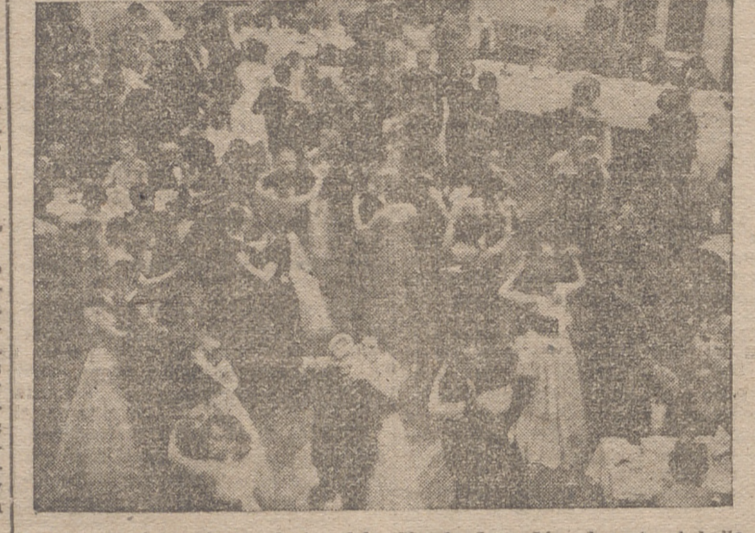
Un detalle del salón de fiestas del «Círculo Logroñés» durante el baile que siguió a la cena de gala.

El ferrial de ganado se mantuvo relativamente flojo durante la mañana, registrando mayor afluencia de ganado y de personal a medida que iba llegando el mediodía. Retratamiento por parte de los compradores, por lo que fueron muy limitadas las transacciones, que seguramente serán mayores en días sucesivos, ya que las conversaciones de ayer fueron de carácter, acordándose más las conversaciones y preparación de operaciones más en las cuerdas que en la cuadrupla.