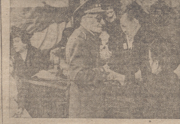
El gobernador militar, coronel M. Bilibiana, al ser asistido en una de las mesas peticoras de la «Fiesta de la Banderita».

Si regular animación dió ayer a nuestras calles la afluencia de forasteros, no menos contribuyó a esa animación desde los principios de la mañana, el ir y venir, con fiadas, joviales, de lo más selecto de nuestra juventud femenina con ese aire alegre y píctico de firmeza propio de la mujer española