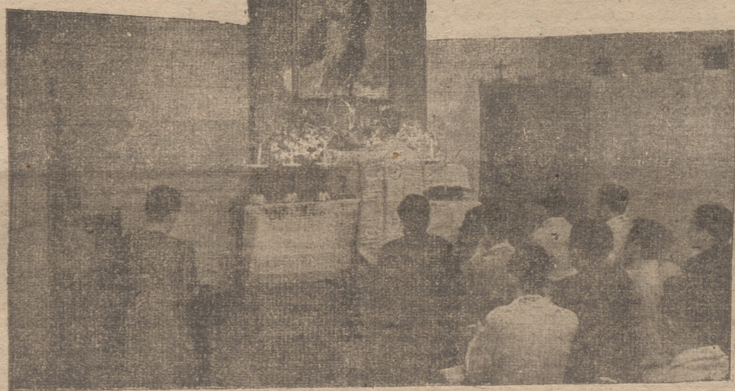
El pasado domingo, 14 de los corrientes, se celebró el Día Mundial de las Congregaciones Marianas.—El grabado recoge el momento en que los congregantes oyen misa en la capilla del Centro.

Más no se trata tan sólo de la benemérita Congregación de Barvijo, oficiada por el M. I. Sr. abad, especialmente las de España.