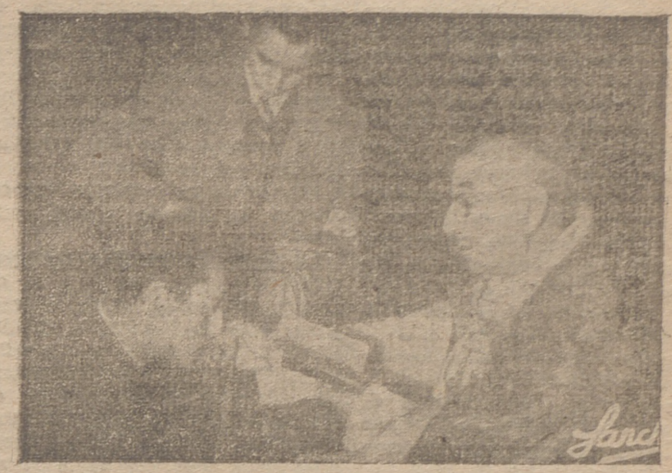
Imposición de medallas a los congregantes logroñeses por el Excmo. Sr. obispo de la diócesis.

Llenos, pues, sus corazones de santo entusiasmo, todos deben con-