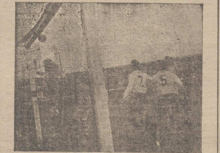
Uno de los innumerables momentos de peligro en la meta del Tudelano

bilido de moverse desde un principio, fué forzada tumba de buenos avances, ya que la ilusión del resto de la vanguardia con él contaba. Segunda. E. terror a los penaltys del árbitro, señor García Hernández, terror que perjudicó notablemente al Maestranza, pues el Tudelano, embotellado durante más de la segunda mitad del último tiempo, incurrió con frecuencia en la máxima falta. El señor García Hernández permitió que el portero visitante saliera a bloquear fuera del área, dió un corner sin querer ver una mano clarísima e intencionada de la defensa, señaló fuera del área una falta que se produjo dos me-