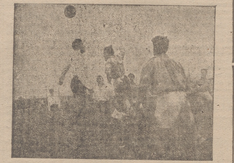
Una muestra de la buena furia de Uncilla.

tros dentro de ella, etc., etc. Más de cinco fueron los penaltys clarísimos que perdonó al Tudelano, mientras que al equipo local sólo perdonó uno producido por un corte intencional, con el brazo, de Oyón.