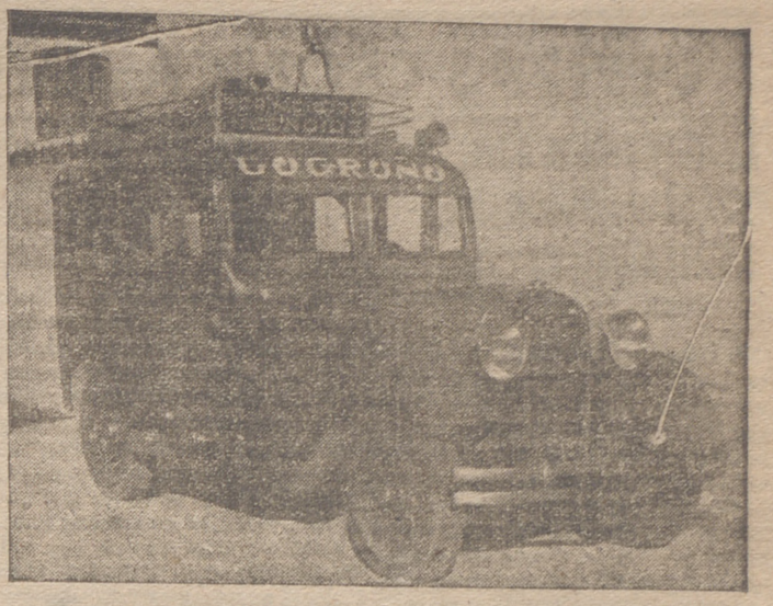
«HUDSON», 26 H. P., 6 cilindros, carrocería mixta, capax para 14 asientos, con galería en la baka, con seis ruedas seminuevas, propio para transporte de viajeros.