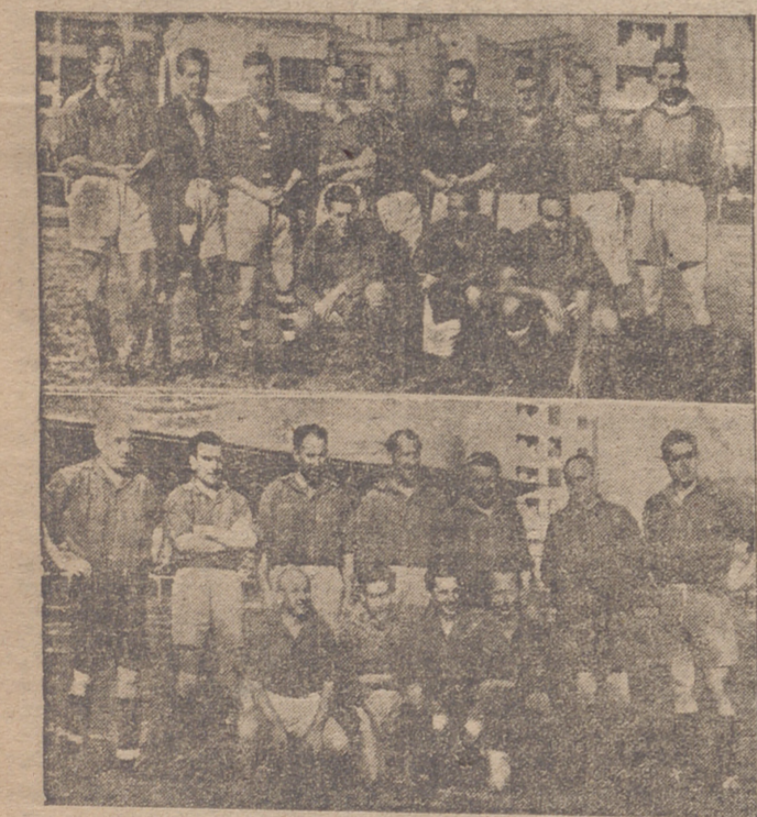
Los equipos de veteranos que ayer se enfrentaron en Las Chirribitas en beneficio de la Cabalgata de Reyes Magos.

que llega a desviar ligeramente la pelota. La victoria la obtuvo el Rayo gracias a un balón que de levo bomba Macua y se cuela por un ángulo. Según noticias recibidas a última hora, el encuentro no es válido para el Campeonato de Aficionados por estar pendiente de resolución una protesta del Arandina, pero sí para el Campeonato Regional, con lo que se coloca en cabeza, muy bien el admirable equipo de aficionados de Logroño. Los equipos se alinearon así: Juventud: Fernández, Paco, Ganza, Quique; Macario Sanz; Saeta, Armeltes, Fernández, Gabillon y Navajo. Rayo: Emilio; Macua, Justo, Las Heras; Olalde, Echevarría; Hernández, Bezares, Reinares, Urbano y Arnedo.