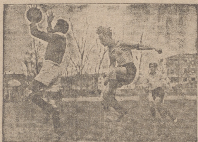
El portero del Juventud para un gran remate de cabeza de Hernández.

El Rayo vence (2-1) al Juventud, de Burgos