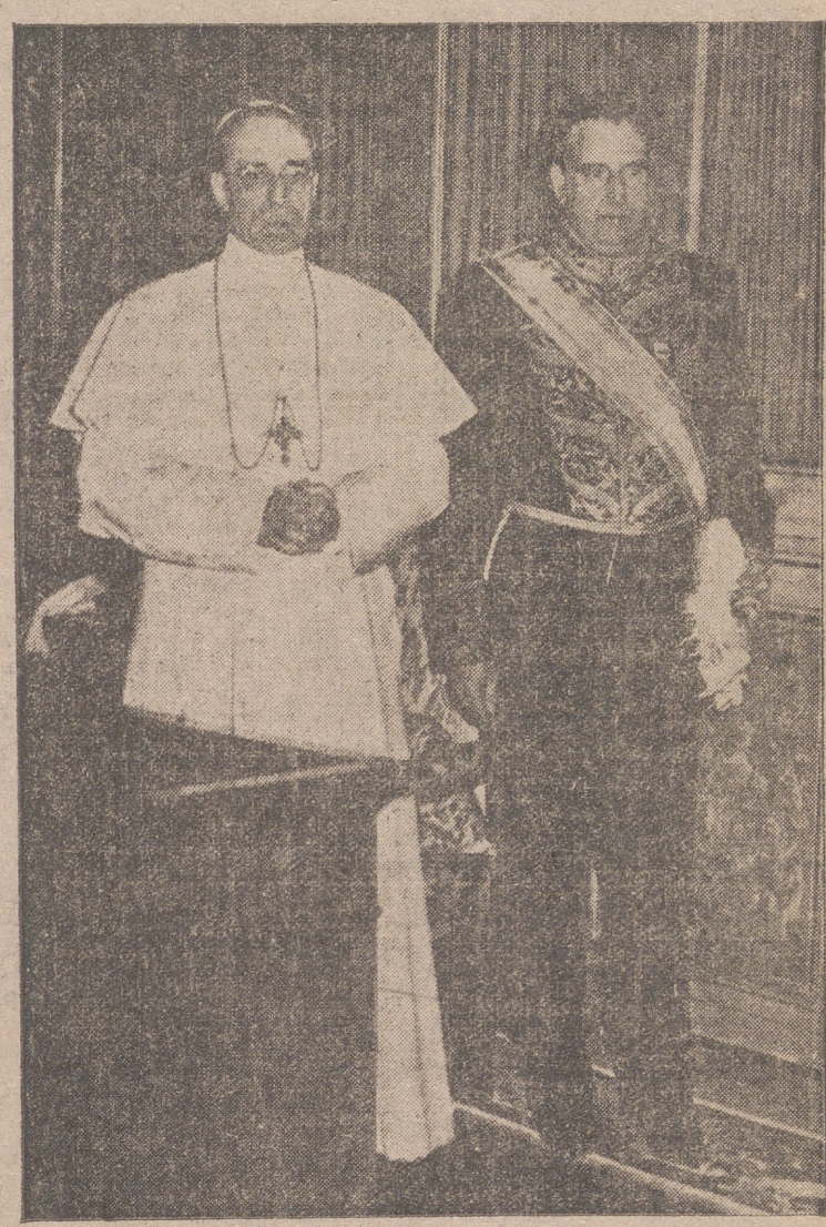
S. S. el Papa, Pio XII, fotografiado con el ministro de Asuntos Exteriores, Sr. Martín Artajo, durante la audiencia concedida al ministro español en la biblioteca particular de Su Santidad.