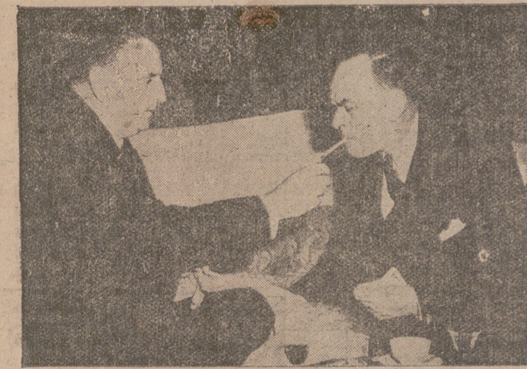
El señor Martín Artajo, ministro español de Asuntos Exteriores, con su colega irlandés, Sean Mac Bride, durante su entrevista en la Embajada de Irlanda en Roma.