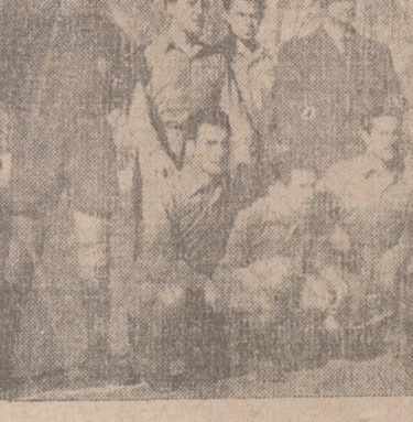
El Numancia, de Soria

El Numancia respondió a lo que esperaba teniendo en cuenta su brillante actuación durante la actual temporada. Es equipo duro, muy duro, y se empleó con gran entu-