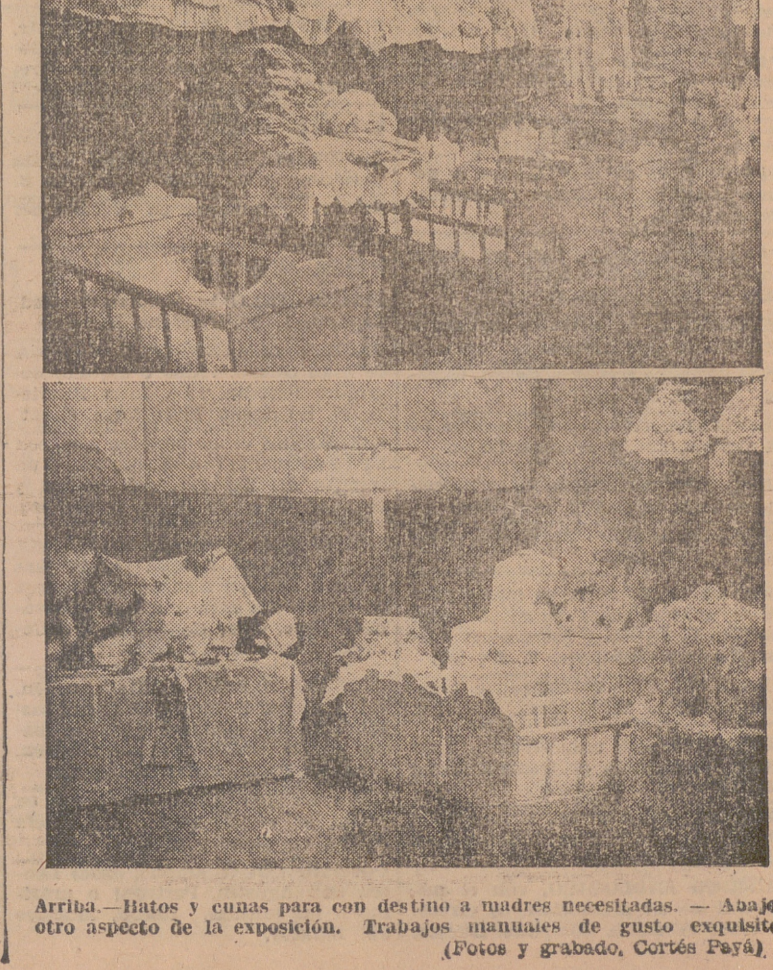
Arriba.—Batos y cunas para con destino a madres necesitadas. — Abajo otro aspecto de la exposición. Trabajos manuales de gusto exquisito.

JUGUETES A LAS JUVENTUDES FEMENINAS Ayer, día 6, en la Casa de Flechas y con asistencia del asesor religioso R. P. Crisanto, carmelita; rectora de Juventudes y Mandos de la Sección Femenina, tuvo lugar el reparto de juguetes entre las pequeñas camaradas, representándose seguidamente el romance «La venida de los Reyes Magos».