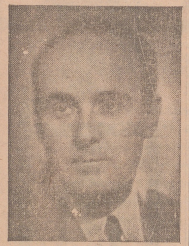
DOCTOR CASTROVIEJO (Foto Jalón Angel y grabado Cortés Payá.)

—Nada. No me preguntes nada. Sólo quiero eso: que expreses mi profundo reconocimiento a todos los paisanos. Y perdóname que no te deje interrogarme, pues estoy en mi pueblo, estoy entre vosotros mis amigos y esta es la gran satisfacción de este mi viaje que tantas ganas tenía de realizar con mi esposa que está encantadísima de España y de los españoles, con que figurate cómo lo estará de los paisanos en cuanto os conozca.