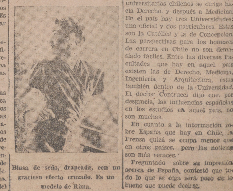
Blusa de seda, drapeada, con un gracioso efecto cruzado. Es un modelo de Rima.

En cuanto a la informacion sobre España que hay en Chile, la Prensa quizá se ocupa menos que en otros países, pero las noticias son más veraces. Preguntado sobre su impresion acerca de España, contestó que todo lo que se diga será poco de lo bueno que puede decirse.