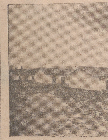
UNA VISTA DEL MISMO GRUPO

En España existen con proyecto redactado 18.557 viviendas. Su presupuesto alcanza la cifra de pesetas 695.381.589,20. En construcción, 12.316 viviendas, con un presupuesto de 467.786.922,39 pesetas, y hasta el presente van entregadas 2.539 viviendas, las cuales, en la actualidad, se están amortizando por sus beneficiarios. Y toda España se puebla de viviendas protegidas, que nos hablan con sus líneas modernas y alegres del éxito espléndido de nuestra labor.