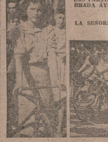
LAS PARTICIPANTES EN LA CARRERA CELEBRADA AYER. EN EL MOMENTO DE TOMAR LA SALIDA.

Con gran animación se celebró ayer por la mañana, en el Circo Imperial, la anunciada reunión de boxeo, que constituyó un gran triunfo para sus organizadores, así como para Educación y Descanso y Deportivo Maestranza, ya que casi do-