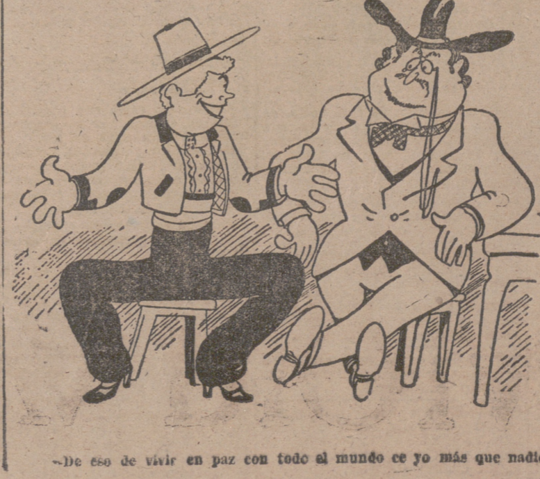
-De eso de vivir en paz con todo el mundo ce yo más que nadie