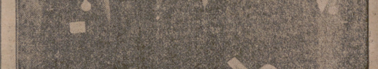
Funerales en Almería por los dos falangistas muertos en Madrid