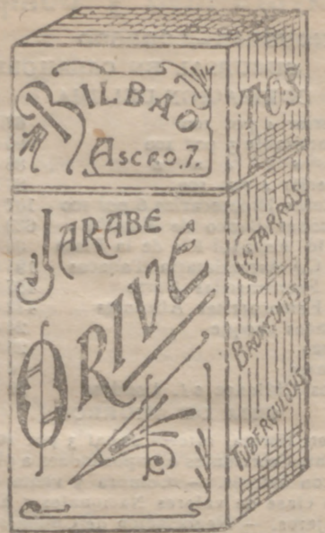
EL MEJOR remedio para EL PEOR catarro, Jarabe Orive.—Precio, 4'25 ptas

Grandes surtidos en artículos de Paquetería, Mercería y similares