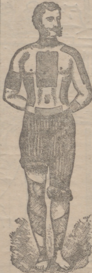
MARCA REGISTRADA EXIGIOLA EN LA CUBIERTA DE CADA EEMPLASTO

No pidáis un parche poroso; os podrian dar una imitación. ¡Pida y exija un EEMPLASTO del Dr. WINTER!